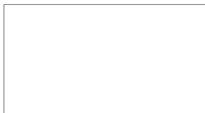
1982 SNOW WHITE