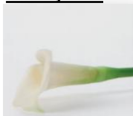
ALUMINIUM DIAMOND VYSOKÝ LESK